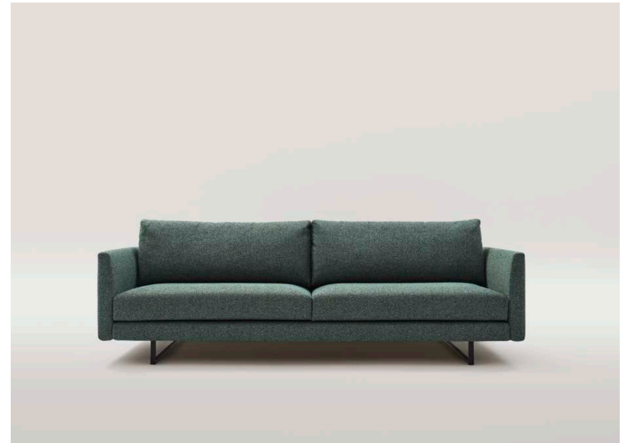
Gross / 1 sofa 205 con dos brazos.